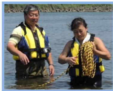
山梨県の水の安全見守り隊