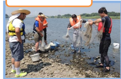
大人は投網の練習