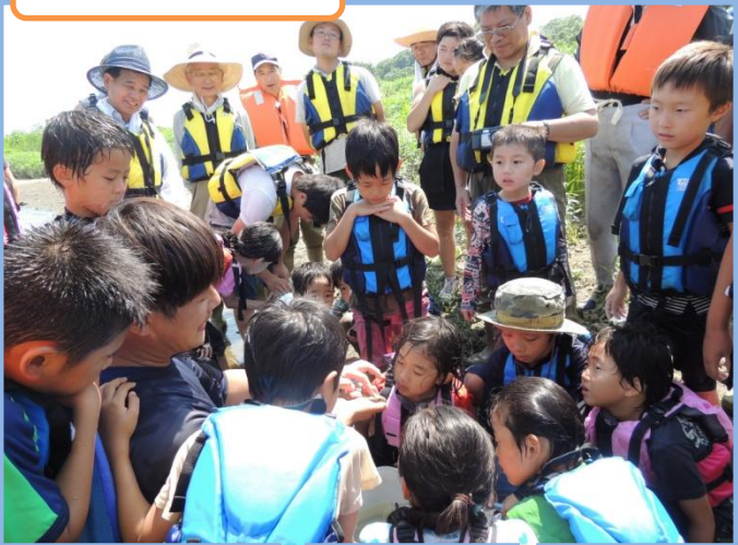
取れたお魚の勉強会