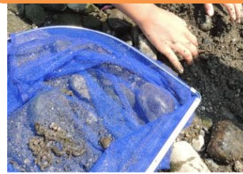
石をめくるとウナギの稚魚