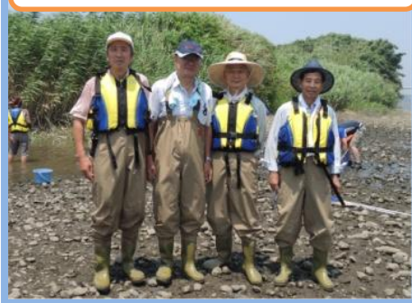
神奈川県の水の安全見守り隊